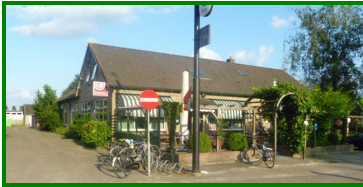
foto 1: eetcafé 't Anker

1. We starten onze wandeling bij eetcafé 't Anker (foto 1) in het centrum van het dorp en gaan vanuit het café linksaf, langs de karakteristieke lindeboom en de basisschool en kiezen het fietspad richting Zorgvlied.