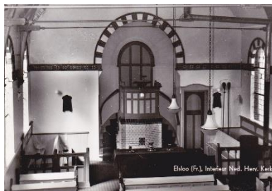
Oude ansichtkaart preekstoel

De preekstoel heeft een dubbele opgang en is vervaardigd van wit geglazuurde baksteen met een houten paneelkuip. Het ruggeschot is van hout. De olieverfschilderijen in de kerk zijn gemaakt door Hinke Harder voormalig in-woonster van Elsloo.