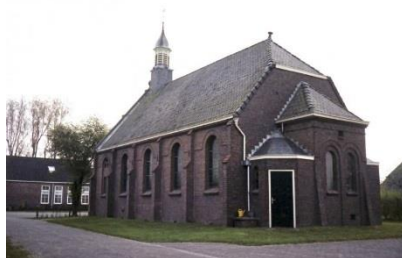
Achterzijde kerk voor de bouw van het Karkehuus.

Het Karkehuus Achter de kerk bevindt zich het Karkehuus. Het Karkehuus werd gebouwd in 1997. De bouw werd betaald uit de verkoopopbrengst van het tegenover de Kerk gelegen pand, dat toen nog eigendom van de Hervormde Gemeente Elsloo was. Bij de bouw van het Karkehuus zijn opvallende concessies gedaan aan de symmetrische bouw van het kerkgebouw.