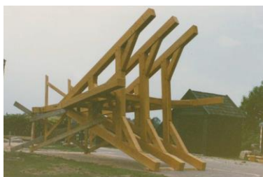
Bouw klokkenstoel in 1987

De klokkenstoel van Elsloo werd gebouwd door het werkvoorzieningsschap 'Zuid Oost Friesland' en werd gefinancierd met subsidies, schenkingen en een in het dorp georganiseerde loterij. Het met natuurleien gedekte dak is versierd met twee koperen pironen. De oudste klok dateert uit de vijftiende eeuw. De andere klok is in 1954 gegoten. In de binnenkant van de klok staat het woord Elsloo.