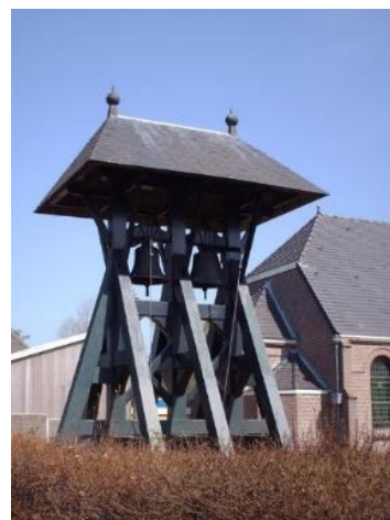
De Klokkenstoel van Elsloo

Klokkenstoelen als losstaande bouwwerken danken hun ontstaan vaak aan het feit dat op sommige plaatsen de kerkgemeentes te klein of te arm waren om zelf een kerk inclusief een kostbare kerktoren te bouwen. Er werden kerkjes gebouwd zonder toren en de klok werd in een aparte klokkenstoel geplaatst. De meeste vrijstaande klokkenstoelen staan daardoor in dorpen of buurtschappen. Veel klokkenstoelen zijn van hout, maar betonnen klokkenstoelen komen ook voor. Vaak worden veldkeien gebruikt voor de fundering.