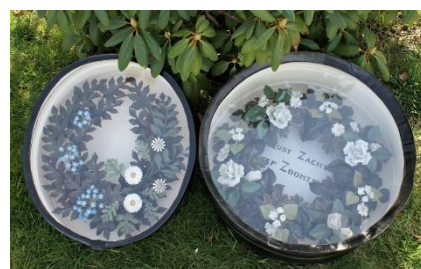
Twee van de negen graftrommels

Door de voormalige kerkenraad van de Hervormde Gemeente Elsloo zijn een aantal graven als bijzonder gekwalificeerd. Dat heeft te maken met: