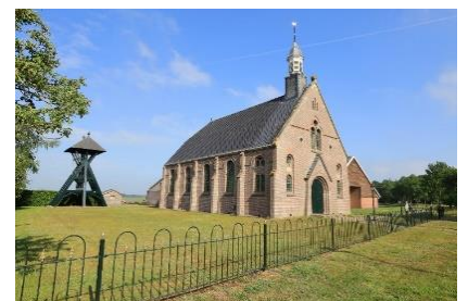
De dorpskerk van Elsloo

Wie de kerk door de voordeur binnenkomt wordt verrast door de intieme sfeer. De banken zijn ossebloedrood geschilderd en de kerk heeft enkele fraaie gebrandschilderde ramen. De preekstoel heeft aan de onderzijde opvallend metselwerk en biedt de voorganger de mogelijkheid de stoel links- of rechtsom te betreden. In 1995 heeft de kerk haar huidige kleuren gekregen. In 1993 is de oorspronkelijke dakbedekking van zwart geglazuurde Lucas IJbrands pannen vervangen door Franse keramische dektegels.